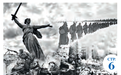
К 80-летию Сталинградской битвы