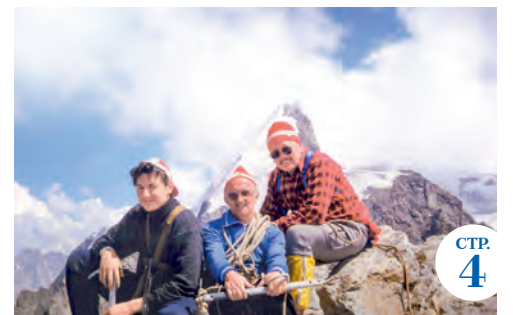
Лучше гор могут быть только горы