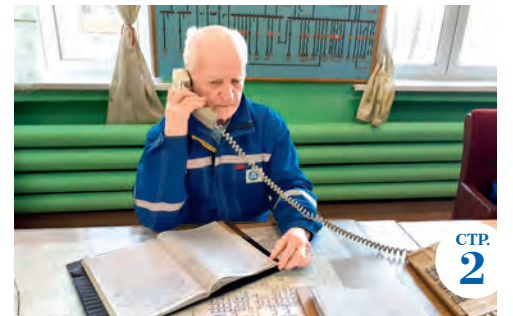
За дело — с энергией!